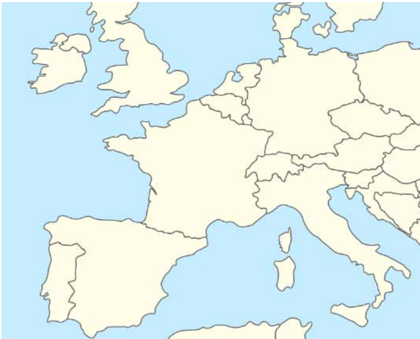
L'Europe en 1943 (au moment de l'histoire du film)

Observe les deux cartes de l'Europe ci-dessous. Quelles différences remarques-tu ?