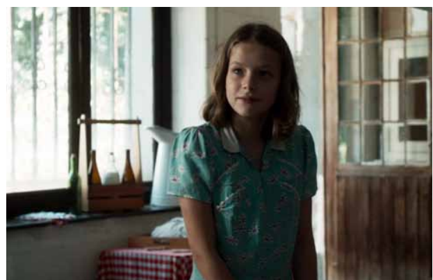
f. Elle est _____