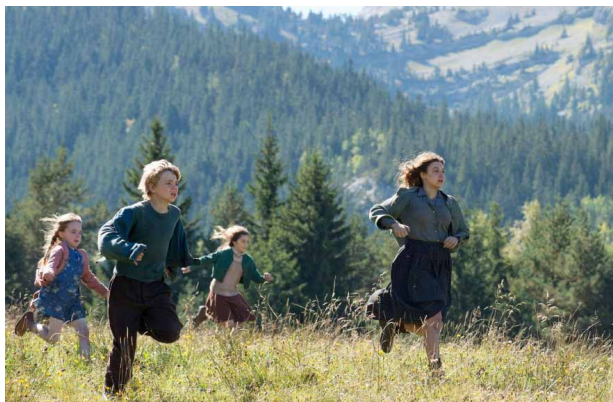
c. Ils sont _____