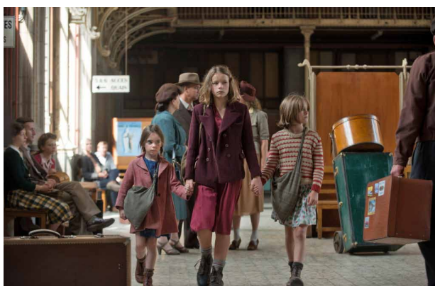
e. Elles sont _____