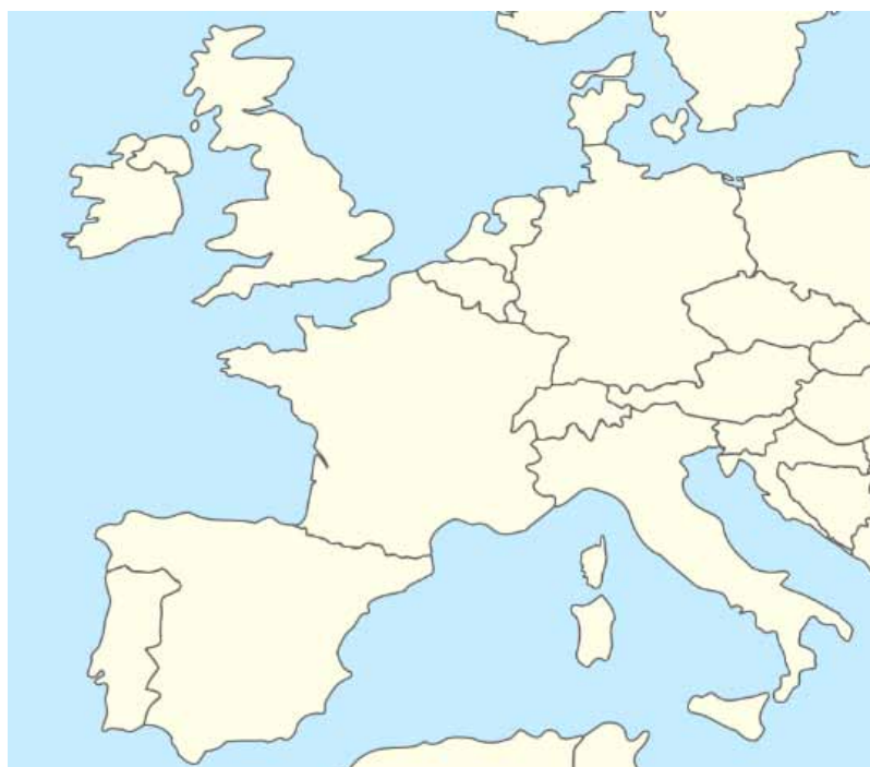
L'Europe en 1943 (au moment de l'histoire du film)

L'Allemagne est beaucoup plus grande (due à l'invasion de la Pologne et à l'annexion de l'Autriche et de l'Alsace-Lorraine).